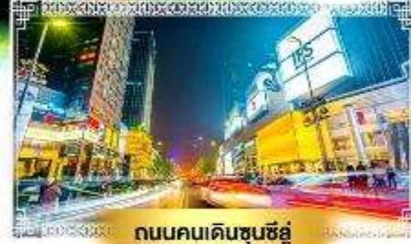
ถนนคนเดินชุนซีอู๋