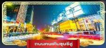
ถนนคนเดินชุนชิว