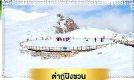
ต้ากู่ปิงชวอ