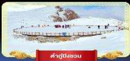
คำกู่ปิงชอน