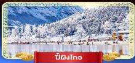
ปี้ดิงโกว

สัมปัสสวรรคบนดินแห่งเมืองจีน เที่ยวสุดคุ้ม 3 อุทยานทางธรรมชาติ