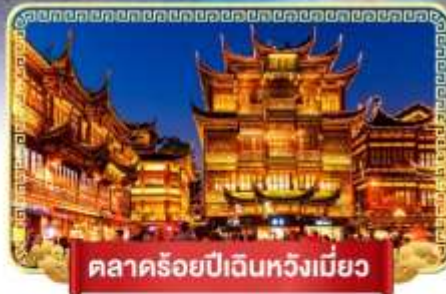
ตลาดร้อยปีเงินหวังเมี่ยว