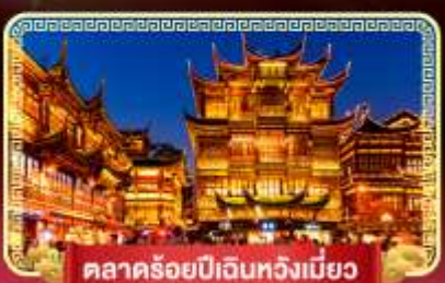
ตลาดร้อยปีเงินหวังเมี่ยว

เที่ยวมหานครสุดทันสมัย "เซี่ยงไฮ้" ถ่ายรูปเช็คอินที่เก๋ที่สุดปัง เมืองจีนฟีลยุโรป