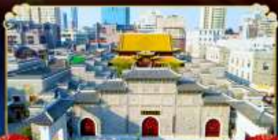
ถนนโบราณวังโซ่งกง

เยือนหมู่บ้านริมผา "นุบเขาเทวดาวังเซียนกู่"