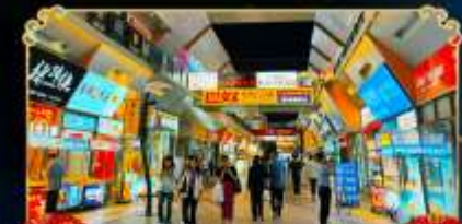
ถนนจินเจีย