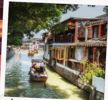
ล่องเรือจูเจียเจี้ยว