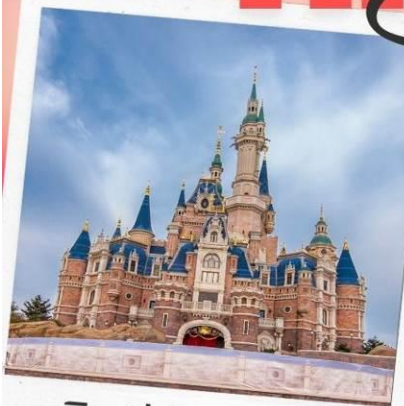
ดิสนีย์แลนด์