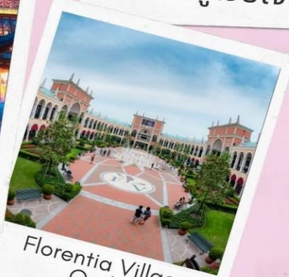
Florentia Village Outlet