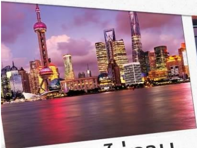
หาดไว่ทาน