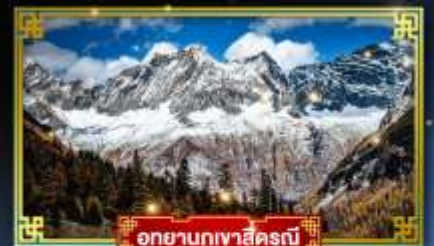
อุทยานภูเขาสี่ครุณี