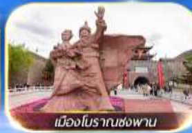
เมืองโบราณซ่งพาน