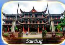
วัดเหวินชู่