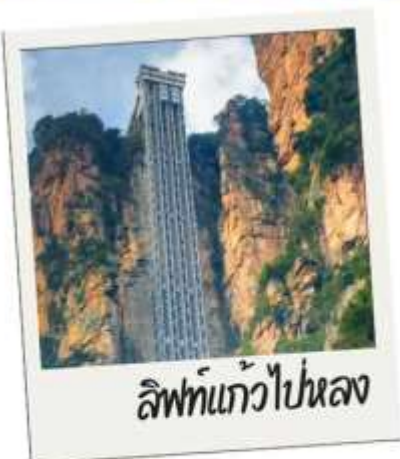
ลิฟท์แก้วไปขนส่ง