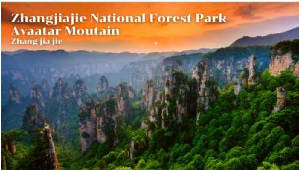
Zhangjiajie National Forest Park Avaatar Moutain Zhang jia jie

รับประทานอาหารกลางวัน มื้อที่ 2 #ภัตตาคารอาหารท้องถิ่น