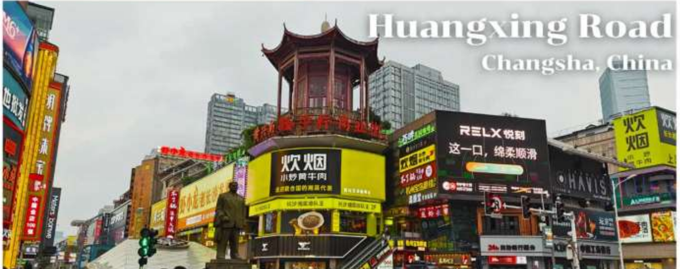
Huangxing Road Changsha, China