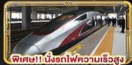
พิเศษ!! นิ่งรถไฟความเร็วสูง