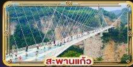
สะพานแกว่ง