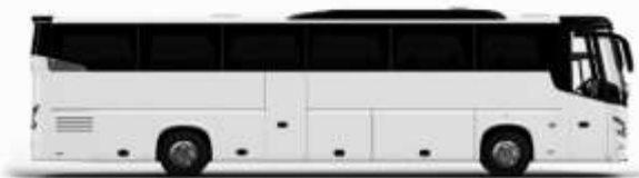
ตัวอย่างรถพลาทอน 1 ชั้น

ค่าที่พักตามที่ระบุในรายการหรือเทียบเท่าระดับเดียวกัน (พักห้องละ 2 ท่าน) หากประเภทห้องที่ท่านริเสวนาเกินจาก เช่น ริเสวนาคอนโดพักเป็น TWIN BED หรือ DOUBLE BED ทางบริษัทขอสงวนสิทธิ์ในการปรับประเภทห้องพัก เป็นตามโรงแรมมีอยู่ โดยไม่ต้องแจ้งให้ทราบล่วงหน้า