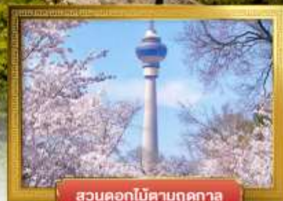
สวนดอกไม้ตามฤดูกาล