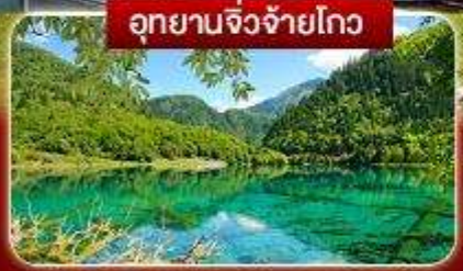
อุทยานจิ่งจ้ายโกว