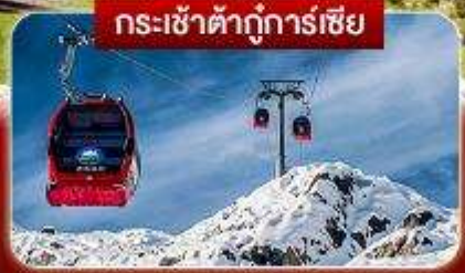
กระเช้าต้ากู่การ์เซีย