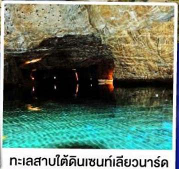
ทะเลสาบไ้ดินเซนท์เลียวนาร์ด

ล่องเรือชมทะเลสาบไ้ดินเซนท์เลียวนาร์ด ทะเลสาบไ้ดินลึกลับ สุด Unseen แห่งสวีตเซอร์แลนด์