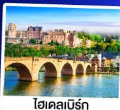
ไฮเดิลเบิร์ก