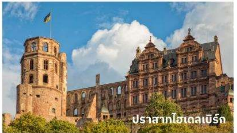
ปราสาทไฮเดลเบิร์ก

จากนั้นนำท่าน เข้าชมปราสาทไฮเดลเบิร์ก ตั้งอยู่บนเนินเขาโดยรอบมีป่าละเมาะแสนสวยให้นักท่องเที่ยวสามารถเดินเล่นได้ บริเวณปาร์กของปราสาทจะมีต้นไม้ใหญ่อย่างต้นเบิช ต้นเมเปิ้ล ต้นโอ๊ค เมื่อขึ้นไปอยู่บนเนินเขาที่ตั้งของปราสาทจะมีจุดชมวิวที่จะมองลงไปดูตัวเมืองเก่าไฮเดลเบิร์ก และยังสามารถเห็นแม่น้ำเนคคาร์ ที่ไหลผ่าน ตัวเมืองไฮเดลเบิร์กอีกด้วย