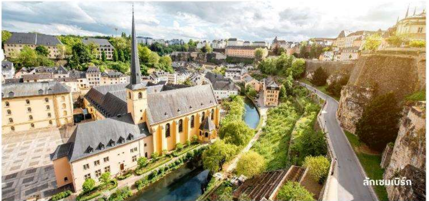
ลักเซมเบิร์ก

นำท่านถ่ายรูปด้านหน้า มหาวิหารนอเทรอดาม ซึ่งเป็นมหาวิหารโรมันคาทอลิก ตกแต่งด้วยสถาปัตยกรรมแบบโกธิคผสมกับเรอเนซองส์ โดดเด่นแปลกตาที่สุดแห่งหนึ่งในยุโรป จากนั้นนำท่านถ่ายรูปด้านหน้า Palace of the Grand Dukes เป็นที่อยู่อาศัยอย่างเป็นทางการของแกรนด์ดยุกแห่งลักเซมเบิร์ก