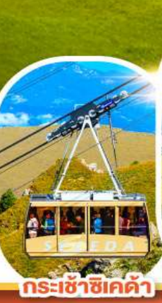
กระเช้าซิคเคต้า