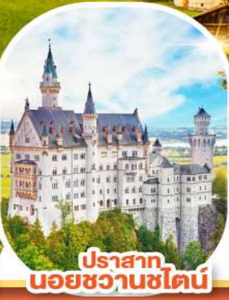
ปราสาท นอยชวานชไตน์