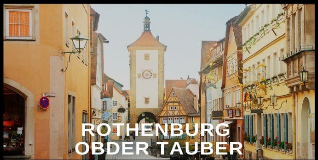
ROTHENBURG OBDER TAUBER