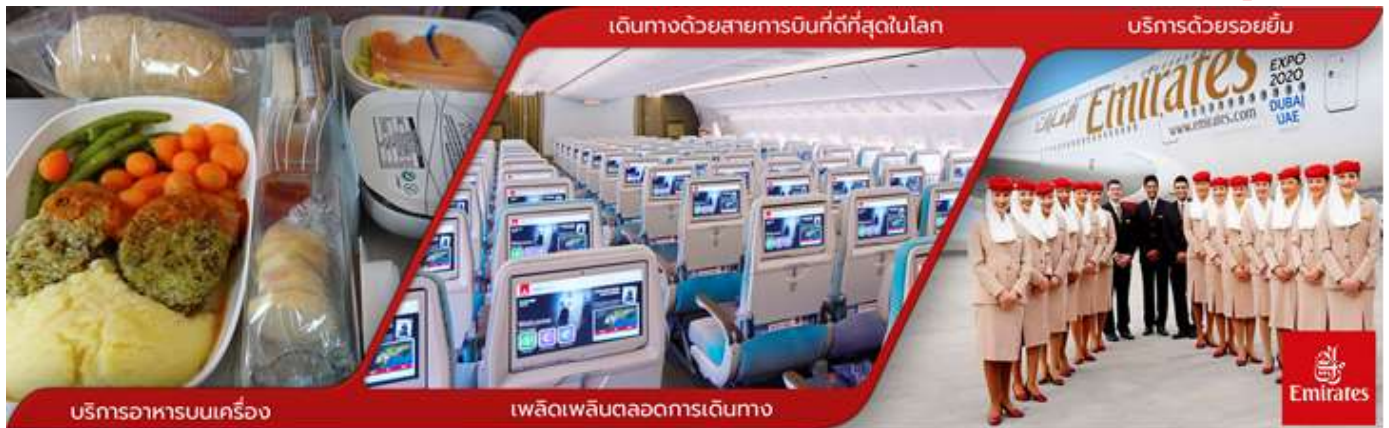
บริการอาหารบนเครื่อง

ทางบริษัทฯ ขอสงวนสิทธิ์ในการจัดที่นั่งบนเครื่องบิน เนื่องจากบัตรโดยสารเครื่องบิน เป็นแบบหมู่คณะ การจัดที่นั่งเป็นระบบ RANDOM ที่นั่งอาจจะไม่ได้นั่งติดกัน ทั้งนี้เป็นไปตามเงื่อนไขของสายการบินเป็นผู้กำหนด