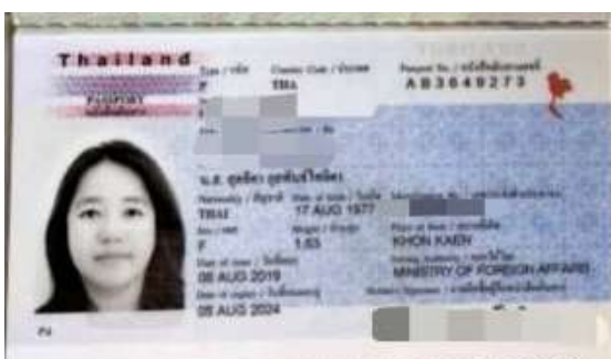
ตัวอย่าง หน้าพาส ยื่น VISA EGYPT