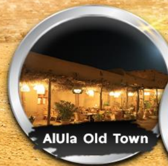
AlUla Old Town