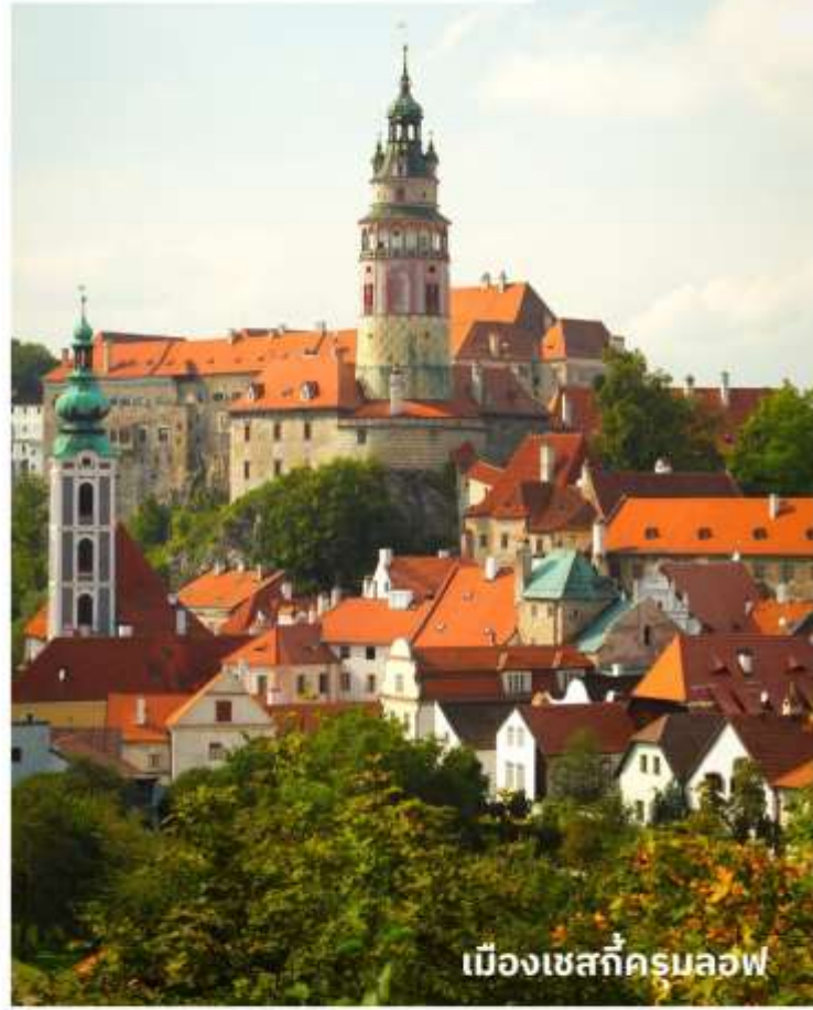
เมืองเชสท์ครุมลอฟ

เพราะรถบัสไม่สามารถเข้าไปส่งถึงหน้าโรงแรมได้