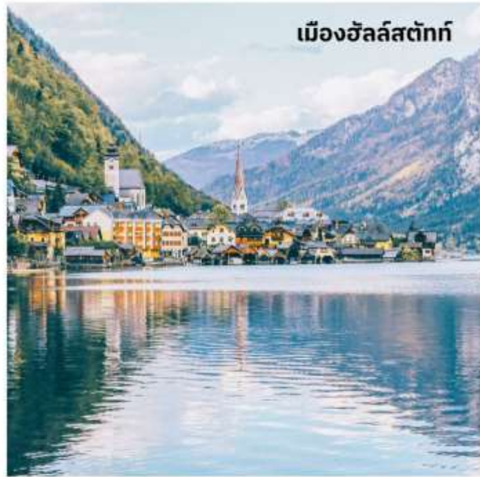
เมืองฮัลล์สตัดท์

ออสเตรียให้ฉายาเมืองนี้ว่าเป็นไข่มุกแห่งออสเตรีย และเป็นพื้นที่มรดกโลกของ UNESCO เพียงเดินเที่ยวชมเมืองก็เสมือนหนึ่งท่าน อยู่ในภวังค์แห่งความฝัน