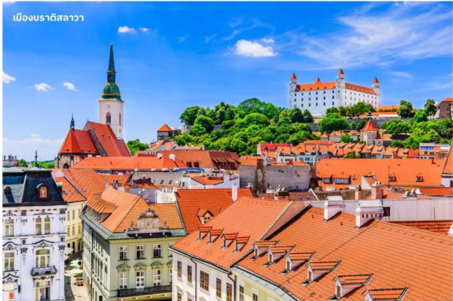
เมืองบราติสลาวา

จากนั้นนำท่านเดินทางสู่ เมืองบราติสลาวา ประเทศสโลวาเกีย ใช้เวลาเดินทางประมาณ 3 ชั่วโมง หรือมีชื่อเรียกอย่างเป็นทางการคือ สาธารณรัฐสโลวัก เป็นประเทศขนาดเล็กที่เพิ่งเข้าร่วมเป็นสมาชิกใหม่ของสหภาพยุโรป เป็นประเทศไม่มีทางออกสู่ทะเล แต่เมืองหลวงแห่งนี้เป็นเมืองที่มีชีวิตชีวาและยังเต็มไปด้วยวัฒนธรรมเก่าแก่ จากนั้นนำท่านถ่ายรูป ปราสาทบราติสลาวา ปราสาทเก่าแก่ที่ตั้งอยู่เหนือแม่น้ำดานูบ เมื่อขึ้นไปบนจุดที่ตั้งของปราสาทจะมองเห็นวิวทิวทัศน์เมืองสโลวาเกียได้ทั่วทั้งเมือง จากนั้นนำท่านเดินทางสู่ ย่านเมืองเก่าบราติสลาวา เป็นที่ตั้งของ ประตูมิคาเอล (Michael's Gate) เป็นประตูและป้อมปราการของเมืองเพียงแห่งเดียวที่ยังคงถูกเก็บรักษาไว้ตั้งแต่สมัยศตวรรษที่ 14