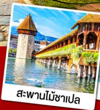
สะพานไม้ซาเปล

11-19 ก.พ. 68 08-16, 15-23 มี.ค. 68 09-17 เม.ย. 68