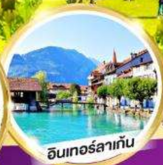
อ็องเทอร์ลาแก้น