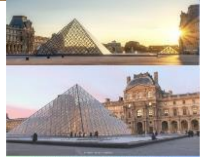
LOUVRE MUSEUM พิพิธภัณฑ์ลูฟวร์