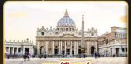
เซนต์ปีเตอร์