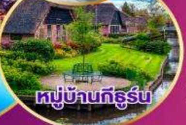
หมู่บ้านทีธูร์น