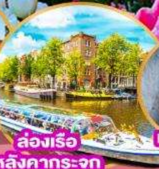
ล่องเรือ หลังคากระจก