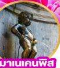
มานเนคพิส