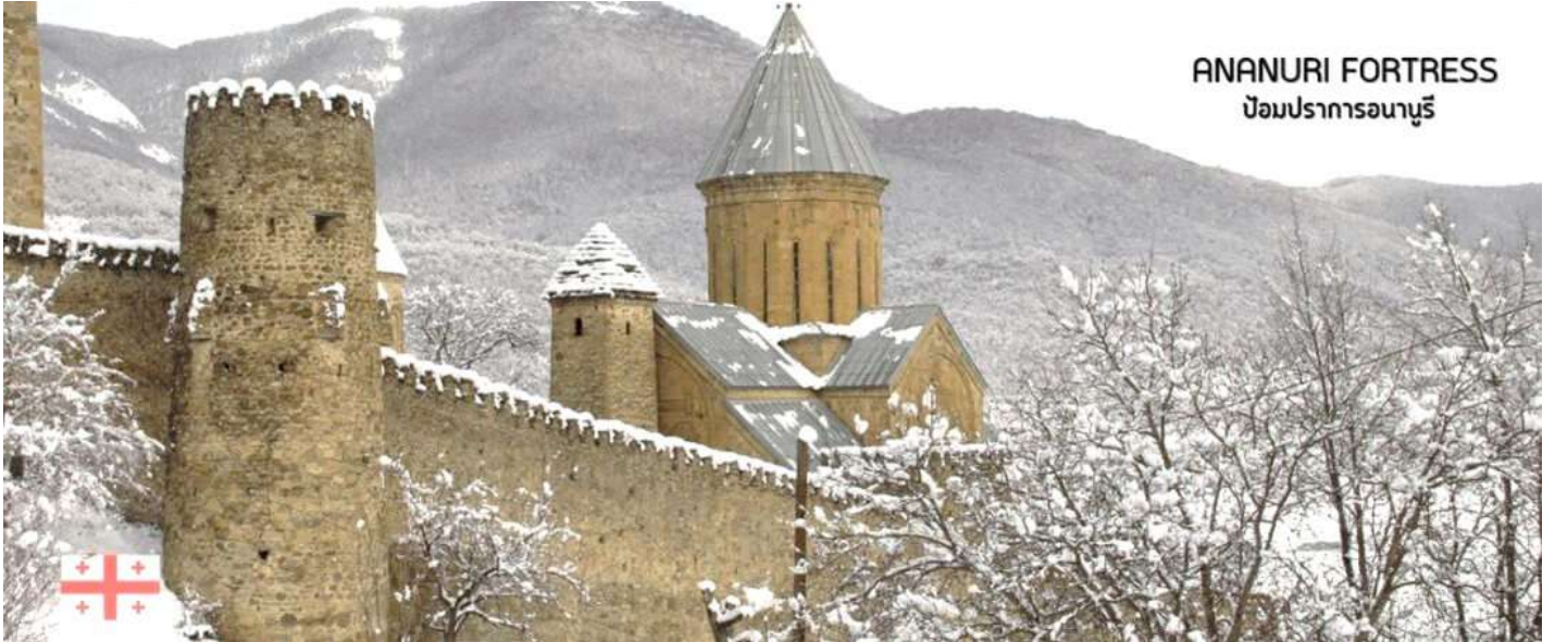
ANANURI FORTRESS ป้อมปราการอนานูรี

นำท่านชม ป้อมอนานูรี (ANANURI FORTRESS) ป้อมปราการเก่าแก่ ที่มีกำแพงล้อมรอบ ตั้งอยู่ริมแม่น้ำอาร์กี สร้างขึ้นในสมัยศตวรรษที่16-17 ภายในยังมีโบสถ์ 2 หลังสร้างอย่างงดงามและยังมีหอคอยทรงสี่เหลี่ยมสูงใหญ่ตั้งตระหง่านอยู่ ทำให้เห็นทัศนียภาพทิวทัศน์อันสวยงามด้านล่างจากมุมสูงของป้อมปราการนี้ (ใช้เวลาเดินทางประมาณ 1.10 ชั่วโมง)