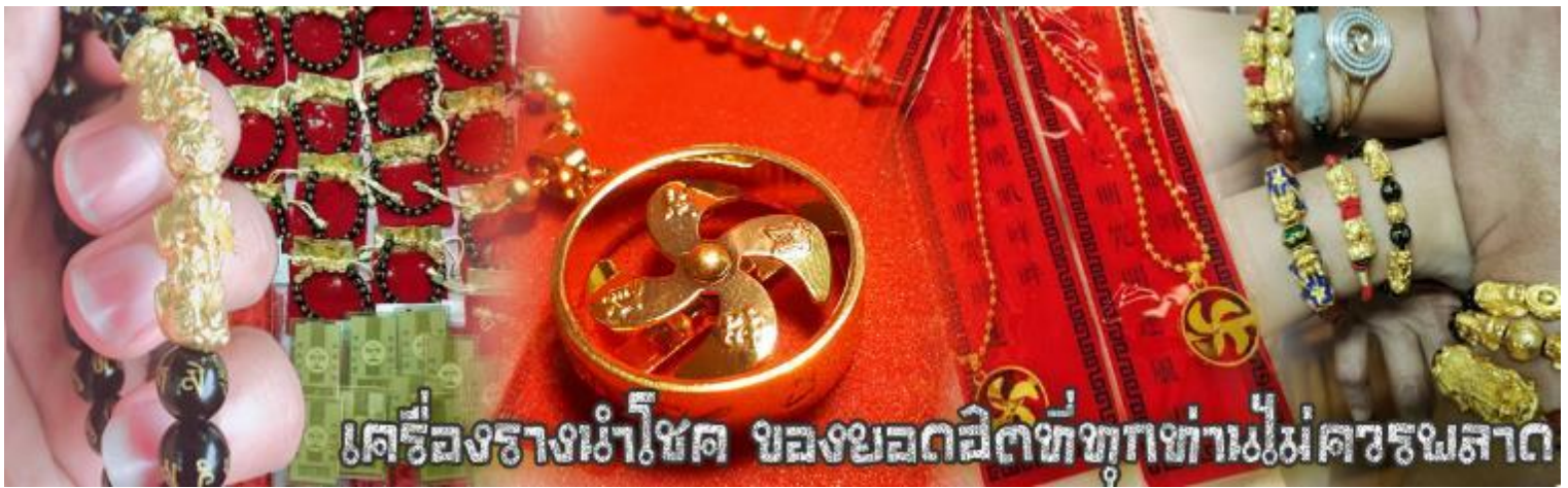
เครื่องรางนำโชค ของยอดฮิตที่ทุกท่านไม่ควรพลาด