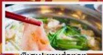
พิเศษ! ชาบูฮ่องกง