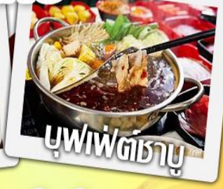
บุฟเฟ่ต์ชาบู