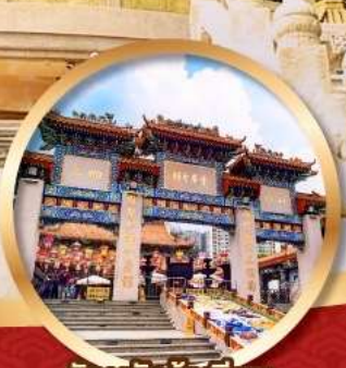
วัดหวังต้าเซียน จอพรด่านสุงภาพ