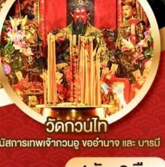
วัดกวนไท่ นมัสการเทพเจ้ากวนอู จออำนาจ และ บารมี