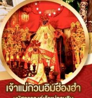
เจ้าแม่กวนอิมฮ้องฮ่า นมัสการองค์เจ้าแม่กวนอิม อายุกว่า 600 ปี