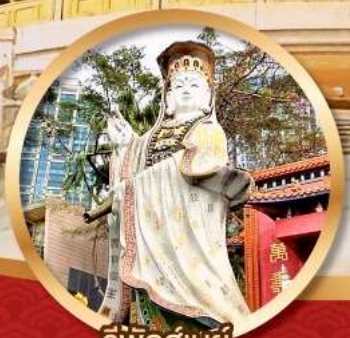
ริพัลส์เบย์ สุงภาพแข็งแรง และ आयูย์ม