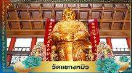
วัดเซกตงฮิว