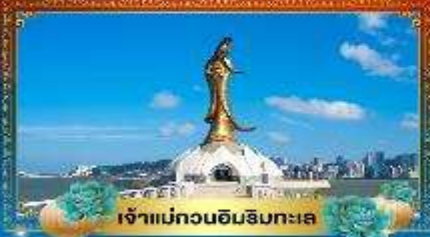
เจ้าแม่ทวนอิมริมทะเล