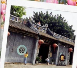
วัดกวนอูเซินเจิ้น