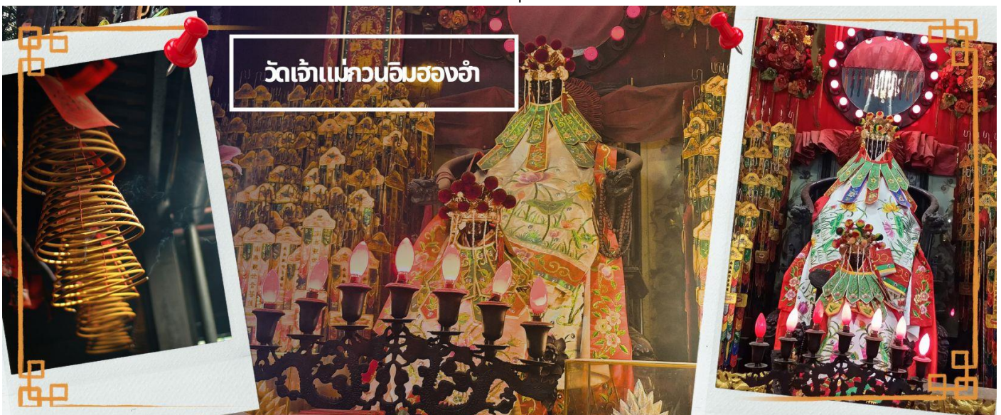
วัดเจ้าแม่กวนอิมสองฮ่า

นำท่านเดินทางกลับสู่ ฮ่องกง โดยรถโค้ช หลังผ่านพิธีการตรวจคนเข้าเมืองเรียบร้อยแล้ว จากนั้นนำทุกท่านเดินทางสู่ วัดเจ้าแม่กวนอิมสองฮ่า (HUNG HOM KWUN YUM TEMPLE) เป็นหนึ่งในวัดที่ชาวฮ่องกงนั้นเลื่อมใสศรัทธามาก ด้วยความที่เจ้าแม่กวนอิมนั้นเป็นเทพเจ้าแห่งความเมตตา ฉะนั้นเมื่อใครมีทุกข์ร้อนอะไรก็มักจะมากกราบไหว้ขอพรให้เจ้าแม่ช่วยเหลือ วัดนี้ถูกสร้างขึ้นในปี ค.ศ. 1873 ในช่วงสงครามโลกครั้งที่ 2 มีการปล่อยระเบิดลงบริเวณวัดสองฮ่าหลายต่อหลายครั้ง ทำให้มีผู้บาดเจ็บและล้มตายมากมาย แต่ชาวบ้านที่หนีเข้าไปหลบภัยในวัดนั้นก็ปลอดภัยและตัววัดก็ไม่ได้ได้รับความเสียหายจากเหตุการณ์ทิ้งระเบิดอย่างน่าอัศจรรย์ และวันสำคัญอีกวันหนึ่งที่คนหลั่งไหลมาไหว้ขอพรอย่างไม่ขาดสายและรอคอยเป็นประจำทุกปี ก็คือ "วันเปิดทรัพย์" หรือ วันยืมเงินเทพเจ้า เป็นวันที่จะมาขอพรและยืมเงินเจ้าแม่กวนอิม ซึ่งตรงกับวันที่ 26 นับจากวันตรุษจีน ซึ่งพิธีนี้ใน 1 ปี มีเพียงครั้งเดียวเท่านั้น