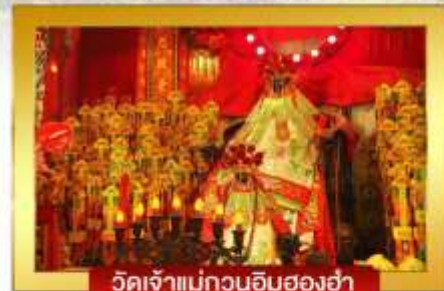
วัดเจ้าแม่กวนอิมฮองฮ่า