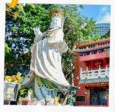
เจ้าแม่กวนอิมรพัสลัมย์

23 กุมภาพันธ์ 2568 วันเยี่ยมเงินเจ้าแม่กวนอิม วัดสองอำ