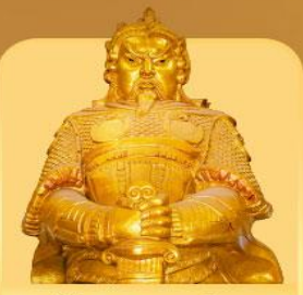
วัดแซงทมิว