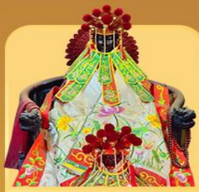
เจ้าแม่กวนอิมสองขำ