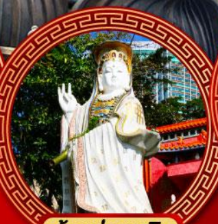
เจ้าแม่กวนอิม รัฟัสส์เบย์