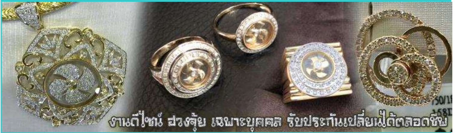
งานตีไข่มุก สว่างล้ำเลิศ เหมาะบุคคล รัชประทีปเมสสิเยร์เม็ดตลอดชีพ

จากนั้นนำท่านสู่ ร้านหยก ชมความงามปีเซียะ ที่เชื่อกันว่าเป็นวัตถุมงคลยอดนิยม ที่มีการนำมาบูชา เพื่อให้ช่วยป้องกันสิ่งชั่วร้าย เรียกทรัพย์สินเงินทองให้ไหลมาเทมา และกักเก็บทรัพย์นั้นไม่ให้รั่วไหลออกไปไหนได้ ชาวจีนโบราณเชื่อกันว่า ปีเซียะเป็นสัตว์ประหลาดที่รวมลักษณะของสัตว์มงคลทั้ง 5 ชนิดไว้ด้วยกัน ได้แก่ มังกร พญาราชสีห์หรือสิงโต, อินทรี, กวาง, และแมว โดยตามตำนานเล่าว่า ปีเซียะเป็นลูกมังกรตัวที่ 9 (เทพแห่งโชคลาภ) ของพญามังกรสวรรค์ มีชื่อเรียกด้วยกันหลายชื่อไม่ว่าจะเป็น “เทียนลก (กวางสวรรค์)” เป็นชื่อเดิม ส่วนจีนกลางตุ้งจะเรียกว่า “เผ่ย่า” และคนจีนแต้จิ๋วจะเรียกว่า “ผีซิว” และ ยังมีจำหน่ายยาสมุนไพรบำรุงเพิ่มความแข็งแรงตามความเชื่อของคนฮ่องกง