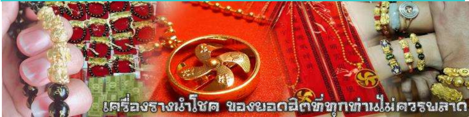
เครื่องรางนำโชค ของขลังศักดิ์สิทธิ์ทุกท่านไม่ควรมลลาต

จากนั้นนำท่านสู่ ร้านหยก ชมความงามปีเซียะ ที่เชื่อกันว่าเป็นวัตถุมงคลยอดนิยม ที่มีการนำมาบูชา เพื่อให้ช่วยป้องกันสิ่งชั่วร้าย เรียกทรัพย์สินเงินทองให้ไหลมาเทมา และกักเก็บทรัพย์นั้นไม่ให้รั่วไหลออกไปไหนได้ ชาวจีนโบราณเชื่อกันว่า ปีเซียะเป็นสัตว์ประหลาดที่รวมลักษณะของสัตว์มงคลทั้ง 5 ชนิดไว้ด้วยกัน ได้แก่ มังกร พญาราชสีห์หรือสิงโต, อินทรี, กวาง, และแมว โดยตามตำนานเล่าว่า ปีเซียะเป็นลูกมังกรตัวที่ 9 (เทพแห่งโชคลาภ) ของพญามังกรสวรรค์ มีชื่อเรียกด้วยกันหลายชื่อไม่ว่าจะเป็น “เทียนลก (กวางสวรรค์)” เป็นชื่อเดิม ส่วนจีนกลางตุ้งจะเรียกว่า “เผ่ย่า” และคนจีนแต้จิ๋วจะเรียกว่า “ผีซิว” และ ยังมีจำหน่ายยาสมุนไพรบำรุงเพิ่มความแข็งแรงตามความเชื่อของคนฮ่องกง