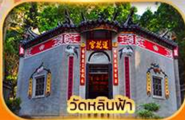
วัดหลินฟา