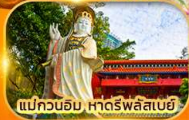
แม่กวนอิม หาดรีพลัสเบย์