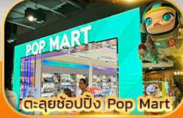
ตะลุยช้อปปิ้ง Pop Mart