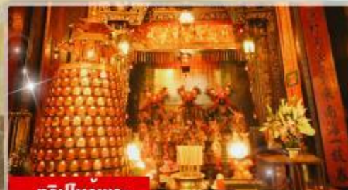
ทริบไหวพร: