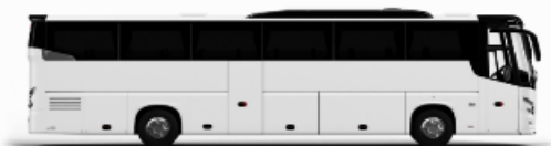
ตัวอย่างรถทัวร์ 1 ชั้น

ค่าที่พักตามที่ระบุในรายการหรือเทียบเท่าระดับเดียวกัน (พักห้องละ 2 ท่าน) หากประเภทห้องที่ท่านริเคเวสมาเต็มจาก ก็เช่น ริเคเวสห้องพักเป็น TWIN BED หรือ DOUBLE BED ทางบริษัทขอสงวนสิทธิ์ในการปรับประเภทห้องพัก เป็นตามที่โรงแรมมีอยู่ โดยไม่ต้องแจ้งให้ทราบล่วงหน้า