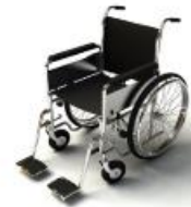
การรับการดูแลเป็นพิเศษ

กรณีผู้เดินทางต้องการความช่วยเหลือเป็นพิเศษ อาทิเช่น การใช้วีลแชร์ กรุณาแจ้งบริษัทฯ อย่างน้อย 7 วันก่อนการเดินทาง มิฉะนั้นบริษัทฯ จะไม่สามารถจัดการล่วงหน้าได้ เนื่องจากการจองใช้วีลแชร์ในสนามบินนั้น ต้องมีขั้นตอนในการขอล่วงหน้า และบางสายการบินอาจมีการเรียกเก็บค่าใช้จ่ายทั้งทางสนามบินในไทยและในต่างประเทศ ซึ่งผู้เดินทางสามารถสอบถามกับเจ้าหน้าที่ได้โดยตรงก่อนทำการจอง และหากในขณะของท่านมีผู้ต้องการดูแลพิเศษ เช่น ผู้ที่นั่งรถเข็น (Wheelchair), เด็ก, ผู้สูงอายุและผู้ที่มีโรคประจำตัวหรือไม่สะดวกในการเดินทางท่องเที่ยวในระยะเวลายาวเกินกว่า 4 - 5 ชั่วโมงติดต่อกัน ท่านและครอบครัวต้องให้การดูแลสมาชิกภายในครอบครัวของท่านเอง เนื่องจากการเดินทางเป็นหมู่คณะ หัวหน้าที่ัวร์มีความจำเป็นต้องดูแลคณะทัวร์ทั้งหมด