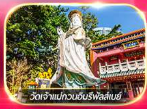
วัดเจ้าแม่ทวนอิมริพลัสเบย์