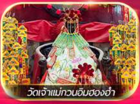
วัดเจ้าแม่ทวนอิมฮองอำ