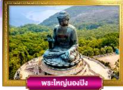
พระใหญ่นองปิง