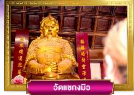
วัดเขangkมมือ