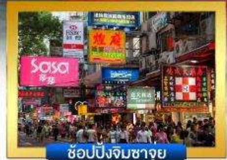
ช้อปปิ้งจิมซาจู้