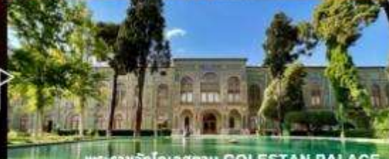
พระราชวังไกลเสถาน GOLESTAN PALACE