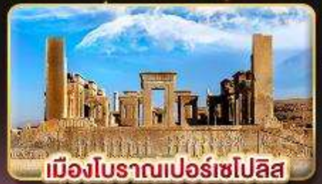
เมืองโบราณเปอร์เซโปลิส

✈️ บินตรง กรุงเทพฯ - เตหะราน คืนภายใน ชิราซ - เตหะราน