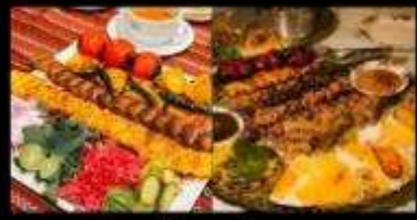
อาหารท้องถิ่นอิหร่านสุดพิเศษ