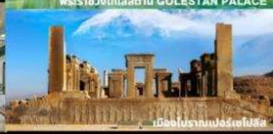
เมืองโบราณเปอร์เซโปลิส