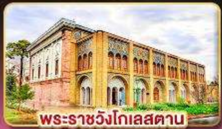
พระราชวังโกเลสถาน

เยือนอารยธรรมเปอร์เซีย เก็บครบทุกไฮไลต์สำคัญ