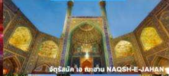
จัตุรัสนัก เร طهران NAQSH-E-JAHAN