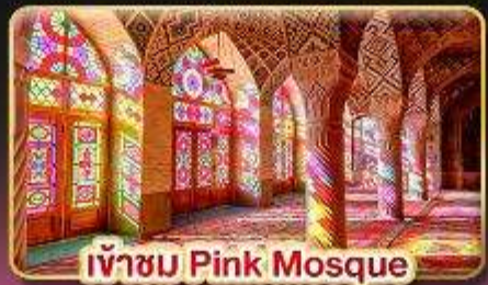
เข้าชม Pink Mosque