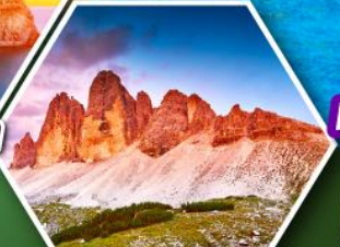
โดโลไมท์