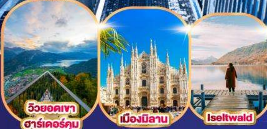
วิวยอดเขา ฮาร์เตอร์คัม