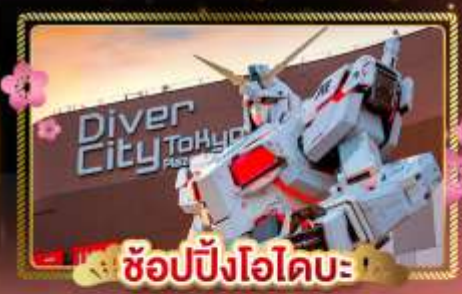
ช้อปปิ้งไอโดบะ