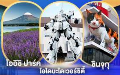
ไออิชิ ปาร์ค ไอโดบะโตเวอริซึตี้ ชินจุกุ

อิสระท่องเที่ยวตามอัธยาศัย หรือเลือกซื้อทัวร์เสริมโตเกียวดิสนีย์แลนด์ แวะจุดชมวิวกไออิชิปาร์ค ฟุจิซึบะ ซากุระ ชมทุ่งดอกฟิ่งค่มอส พิพิธภัณฑ์แผ่นดินไหว DUTY FREE ไอโดบะโตเวอริซึตี้ ซุปป์ิงชินจุกุ