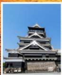
ปราสาทคุมาโมโตะ