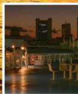
Meimon Taiyo Ferry