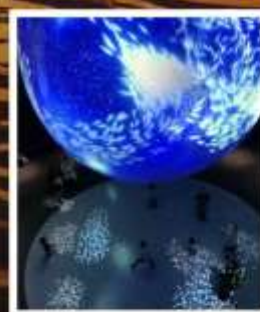
พิพิธภัณฑ์สัตว์น้ำนิเพส