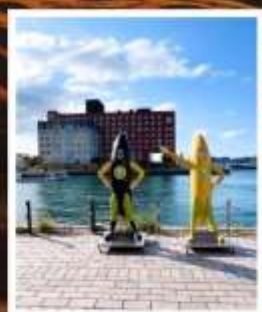
โมจิโกะทาวน์