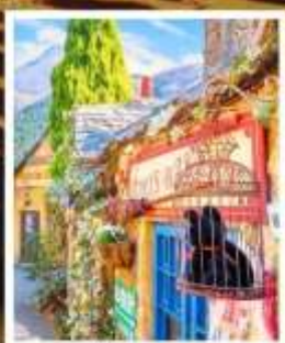
หมู่บ้านยูฟูอินพลอร์รัล