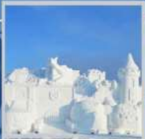
"ASAHIKAWA SNOW FEST"