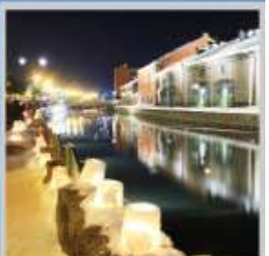
"OTARU CANAL FEST"