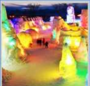
"SHIKOTSU ICE FEST"