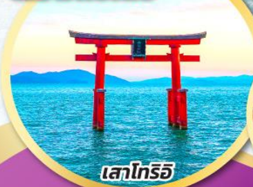
เสาโทริอิ